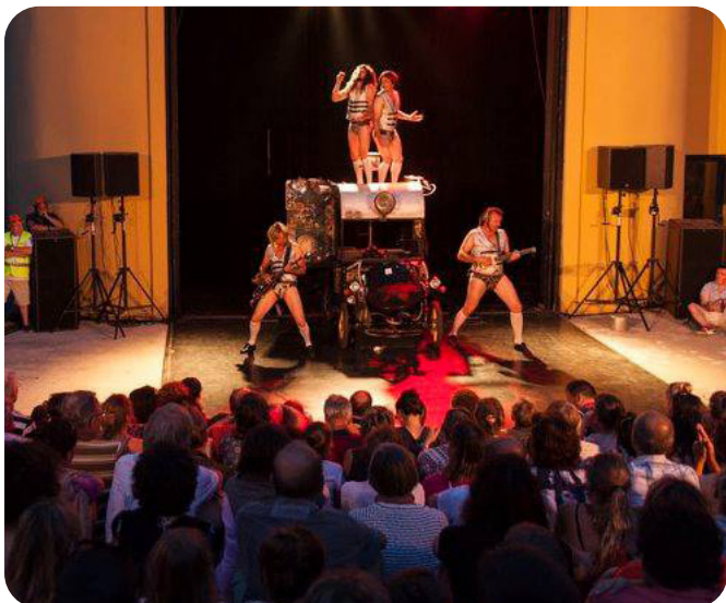
Retour vers No Futur (2015)