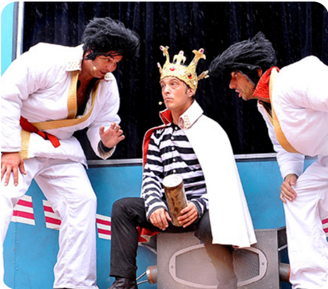
Dans le corps d'Elvis (2012)