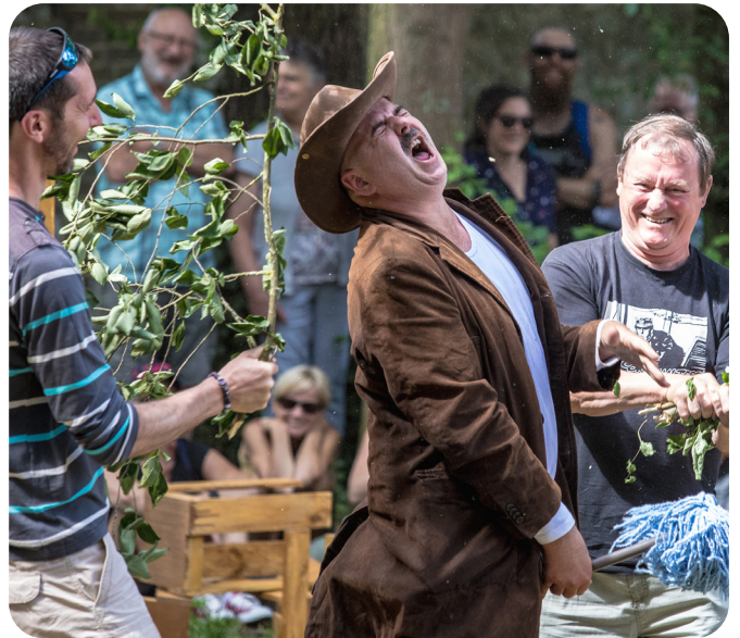
Sandy et le Vilain Mc COY (2018)