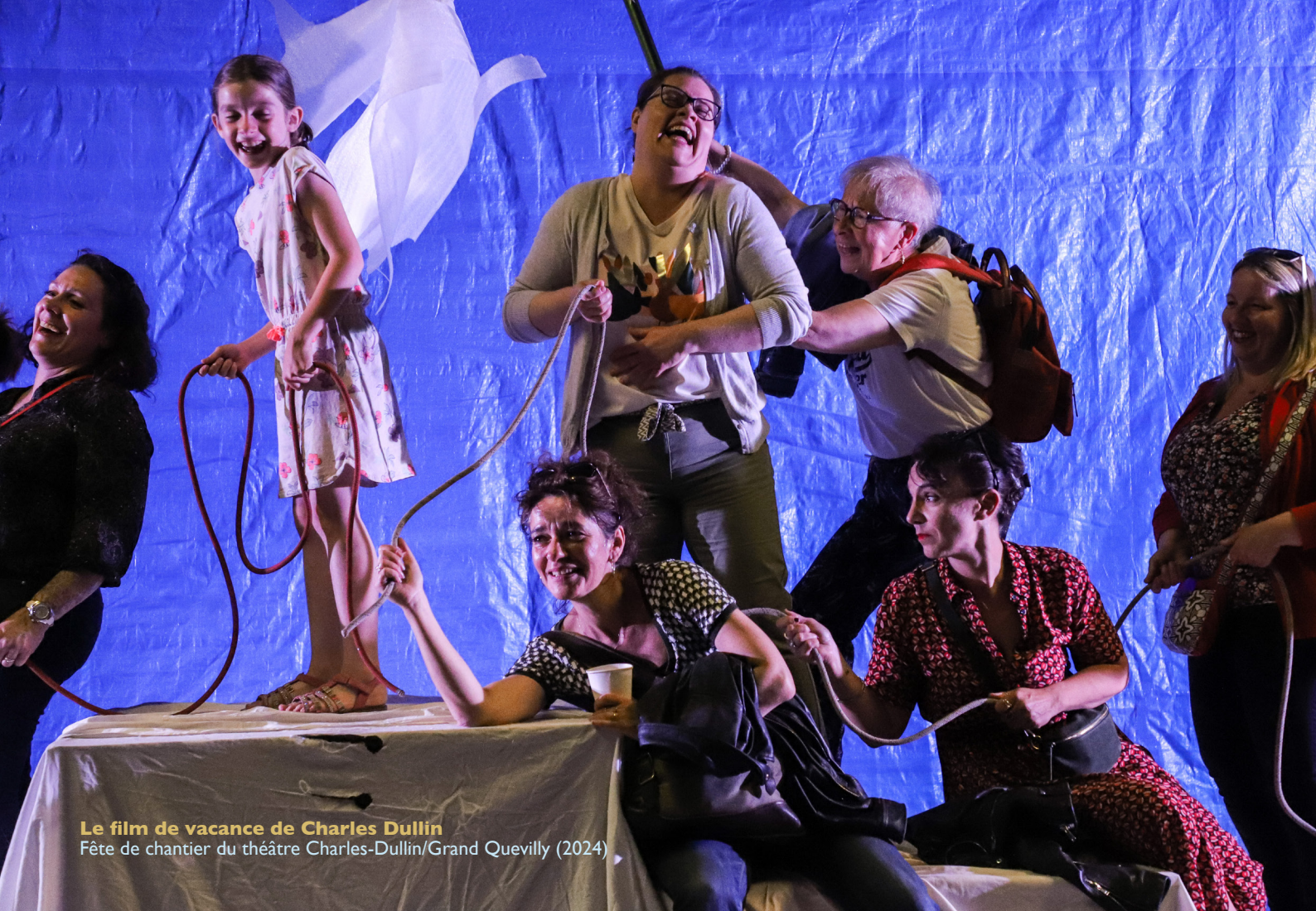
Le film de vacance de Charles Dullin Fête de chantier du théâtre Charles-Dullin/Grand Quevilly (2024)