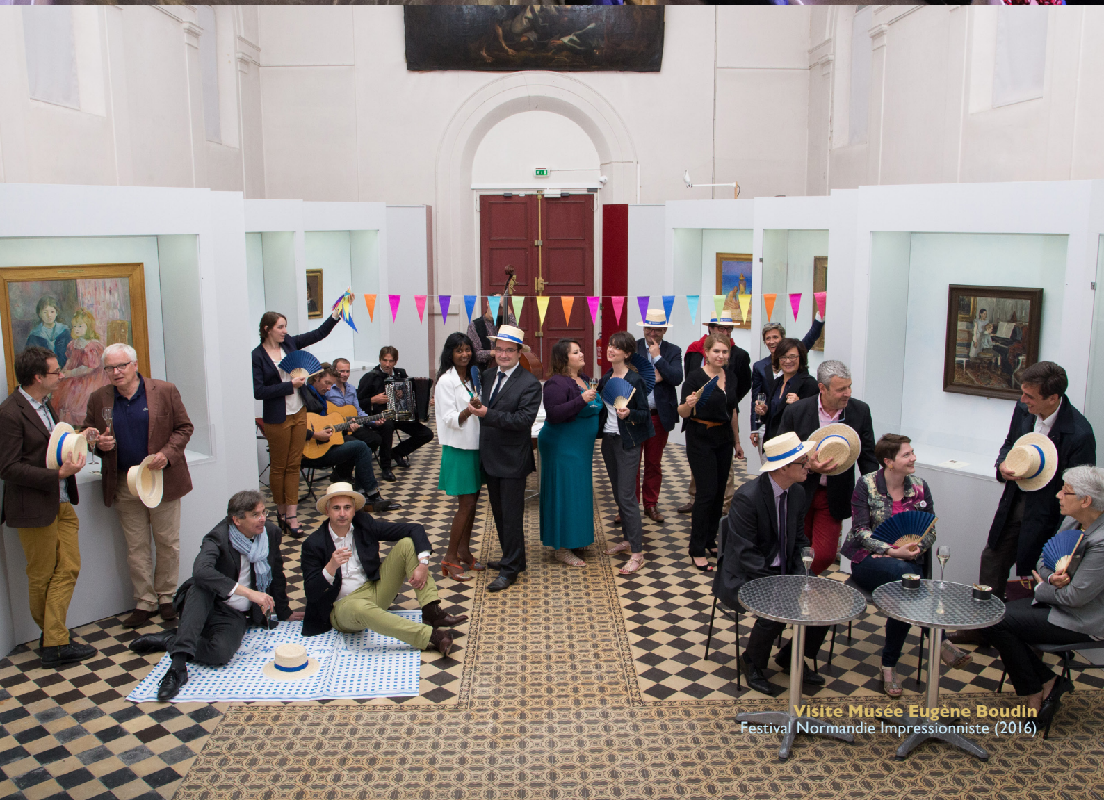
Visite Musée Eugène Boudin Festival Normandie Impressionniste (2016)