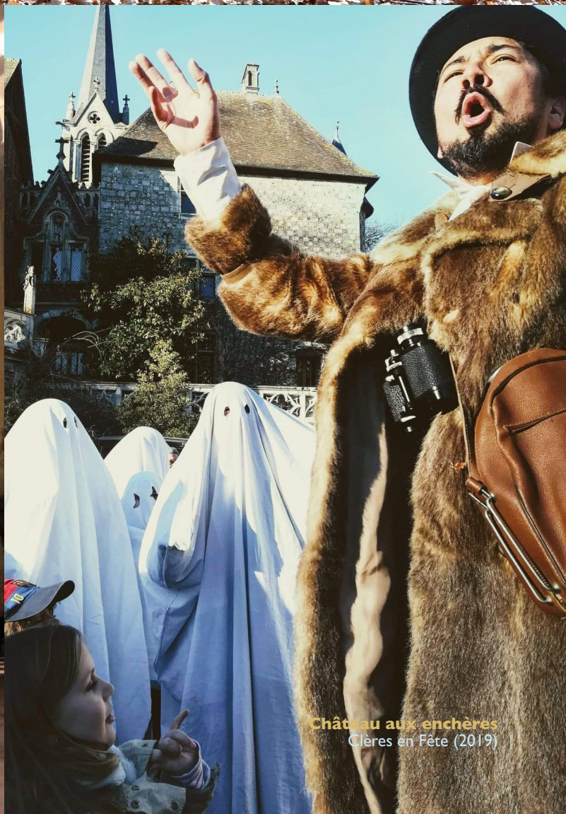
Château aux enchères Clères en Fête (2019)