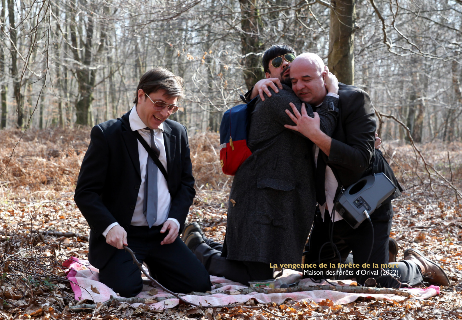
La vengeance de la forêt de la mort Maison des forêts d'Orival (2022)