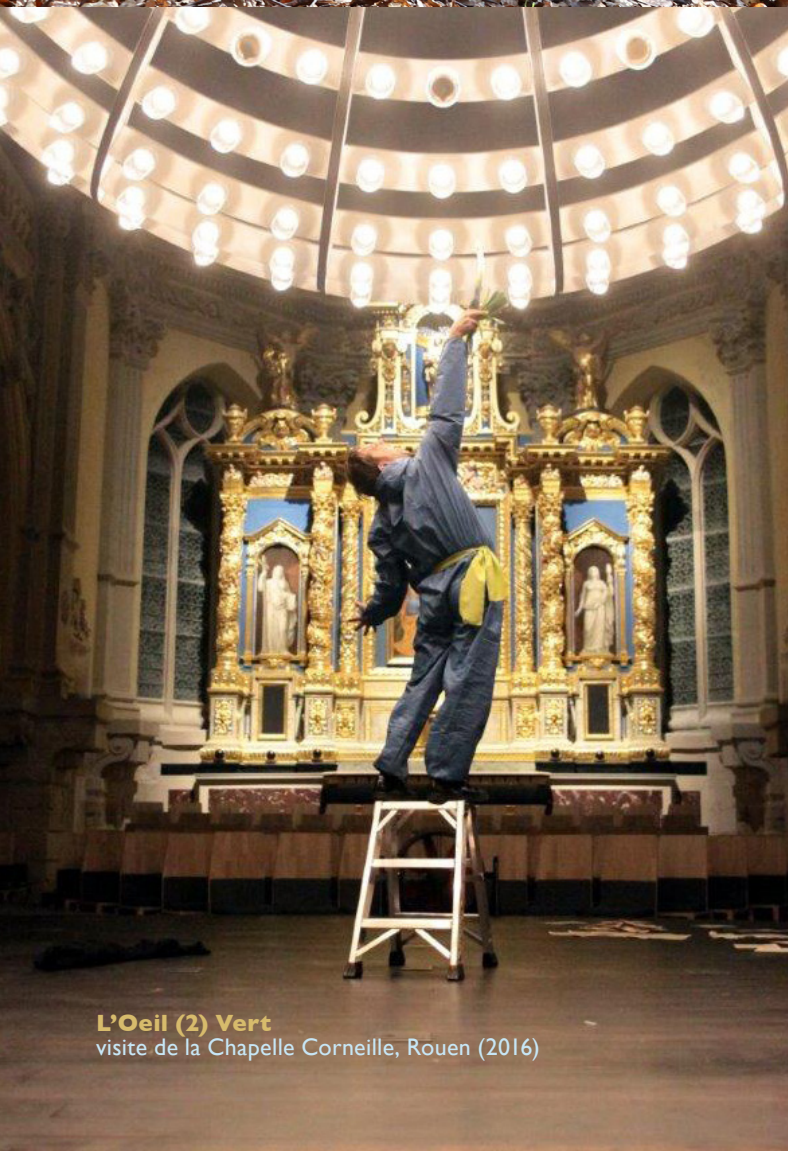
L'Oeil (2) Vert visite de la Chapelle Corneille, Rouen (2016)